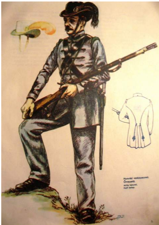
Az elitegységek katonái: honvédvadász és gránátos