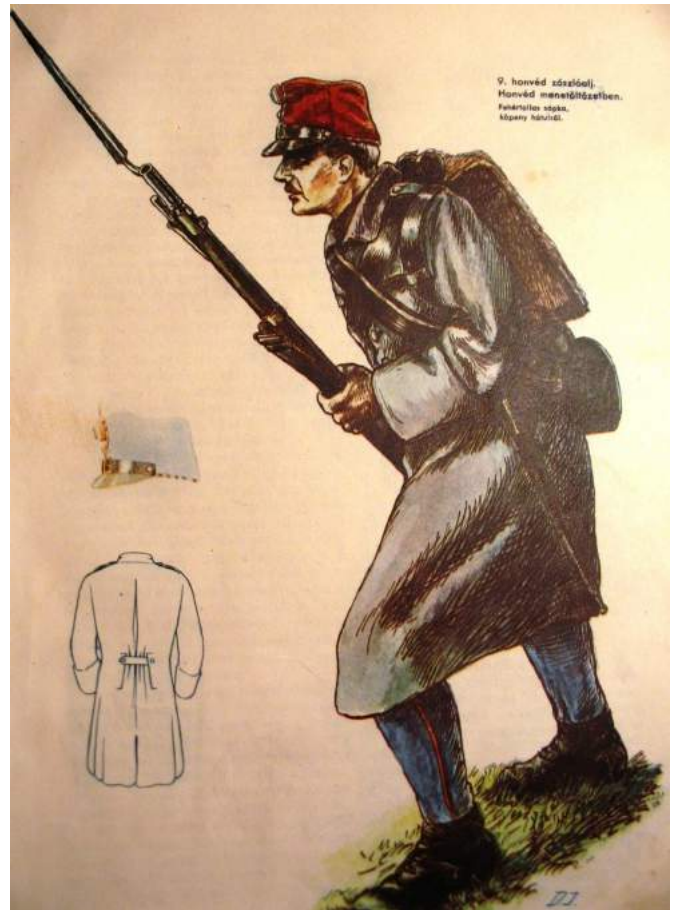
A 9. honvédzászlóalj veressipkás katonája